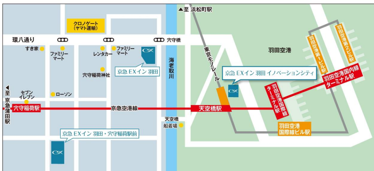
京急EXイン 羽田エリア3棟目の出店