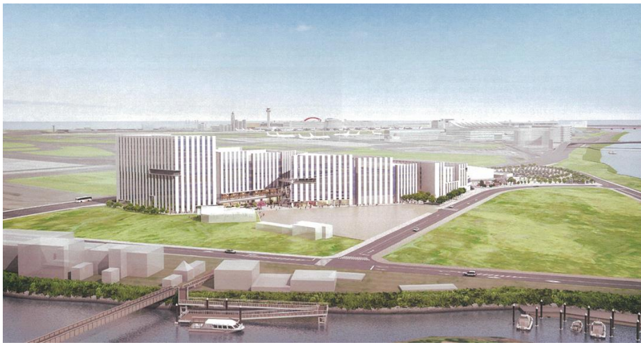
HANEDA INNOVATION CITY 全体外観完成予想図